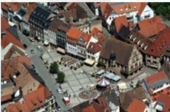
Place de l'Hôtel de Ville