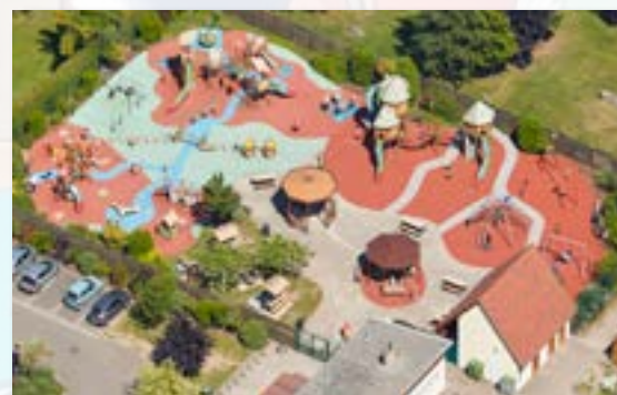
Paradis des enfants