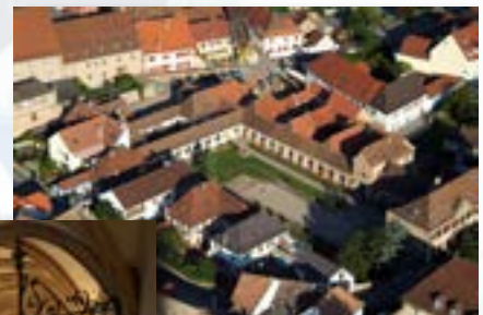
Musée de La Chartreuse