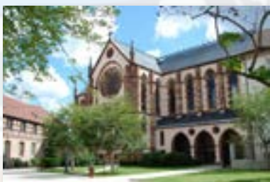
Chapelle Notre Dame