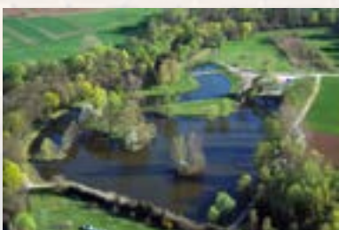
Etangs du Zich