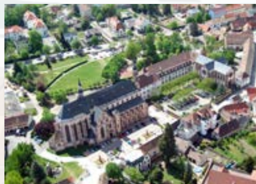
Eglise des Jésuites