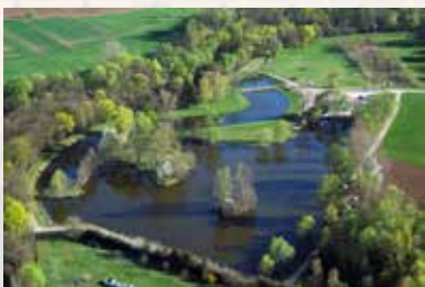
Etangs du Zich