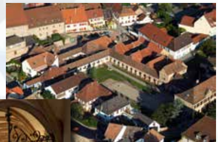
Musée de La Chartreuse