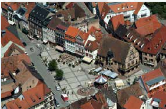
Place de l'Hôtel de Ville