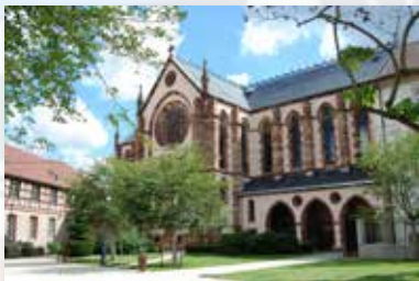
Chapelle Notre Dame