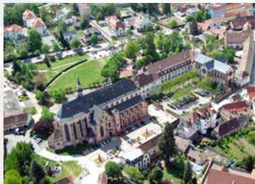
Eglise des Jésuites