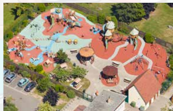
Paradis des enfants